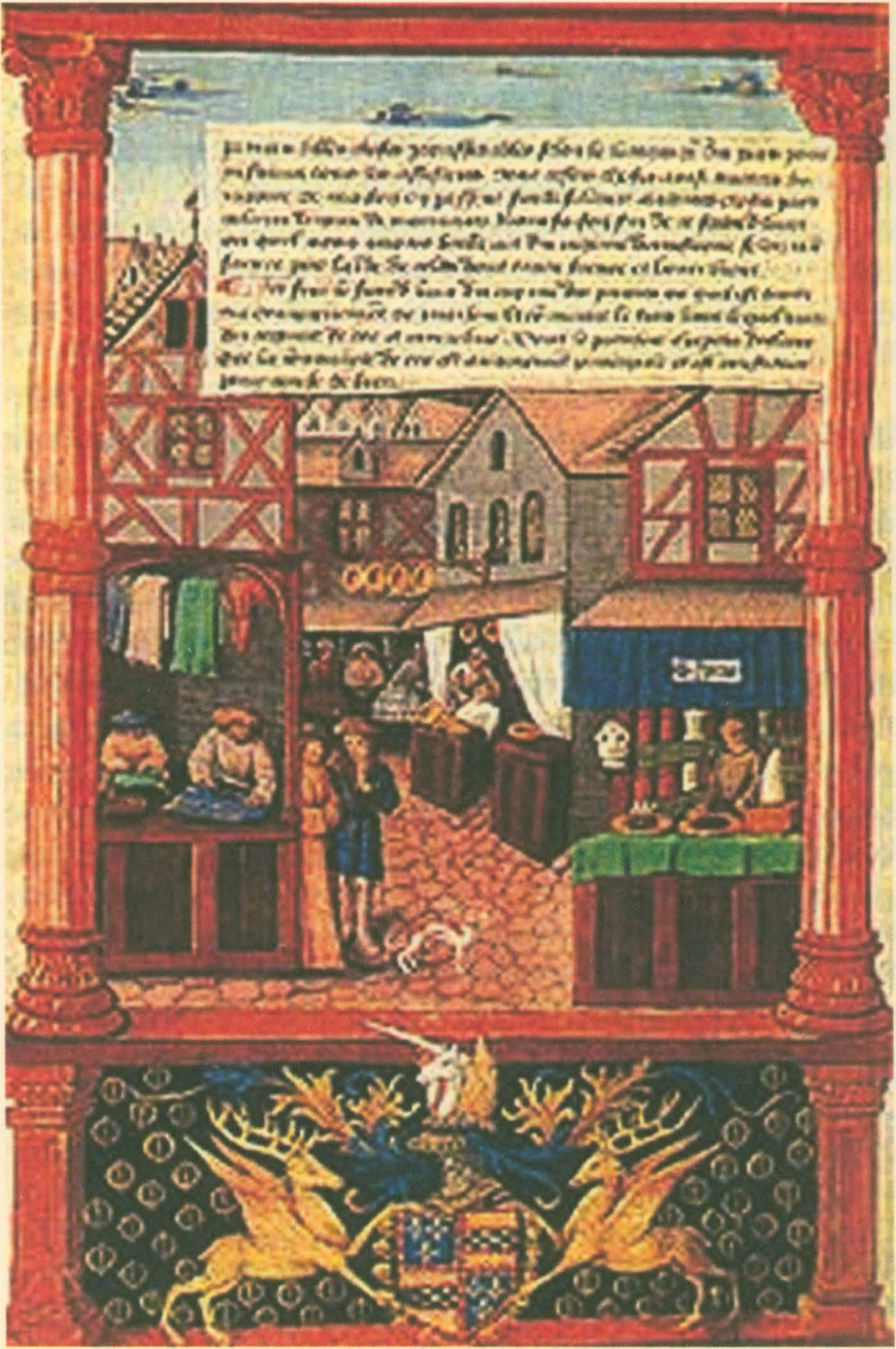
Pazar yerinden bir görünüş